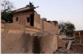
Barrios Altos tiene muy pocos espacios públicos y áreas verdes - es una de las áreas con menos metros cuadrados de espacios abiertos por

Asimismo, las condiciones de hacinamiento, los altos niveles de humedad, junto con el tipo de materiales de construcción, aumentan las enfermedades respiratorias y de la piel.