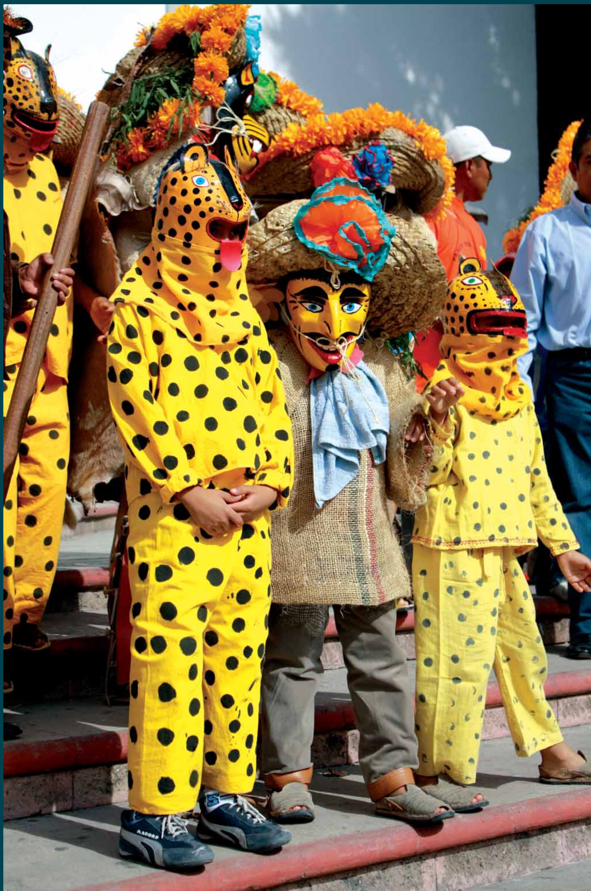
Niños Tecuanes, Paseo del Pendón, Gro. 2009. Juan Atlano

“Patrimonio Cultural: su concepción desde la Antropología y la Historia”